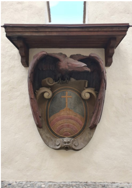
AMCF, Scultura lignea con aquila tirolese e stemma della Magnifica Comunità di Fiemme, oggi posto all'interno del revellino nord dell'ex Palazzo vescovile di Cavalese.

L'opera in questione, oggi visibile sulla parete interna del revellino nord, fu realizzata dallo scultore di Anterivo Alois Zwerger nel 1917, in piena Prima guerra mondiale. Essa rappresenta una grossa aquila che con le ali avvolge, quasi a proteggerlo, il secolare stemma della Magnifica Comunità di Fiemme.